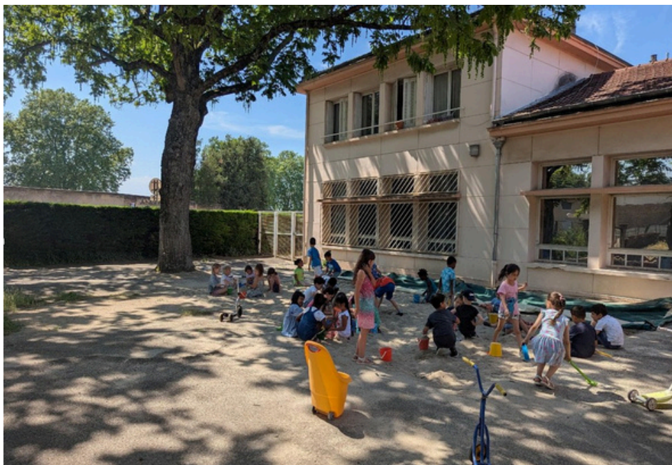
La récréation avec les élèves de Grande Section à l'école maternelle de la Sarra.